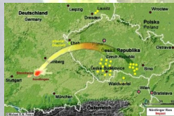
Strooigebied Nördlinger Ries